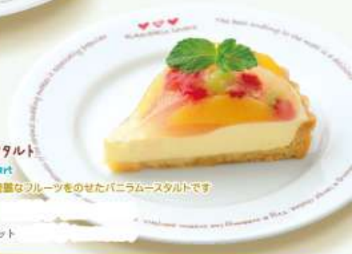
フルーツタルト Fruits tart いろいろ綺麗なフルーツをのせたパニラクリームタルトです