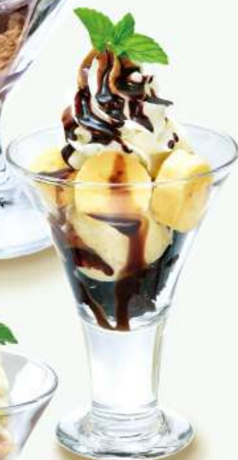
チョコバナナサンデー Chocolate and Banana Sundae チョコブラウニー、バナナとパニラアイスのサンデー