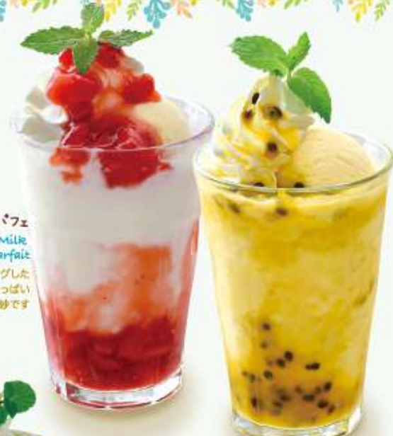
オレンジパッションフルーツスムージーパフェ Orange and Passion-fruit Smoothie Parfait パニラアイスとホイップをトッピングした食べ応えのあるスムージーにプチプチ食感がたまらないパッションフルーツとオレンジのほどよい酸味がほじけます