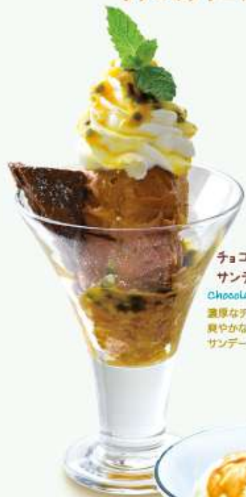
チョコとパッションフルーツのサンデー Chocolate and Passion-fruit sundae 濃厚なチョコブラウニーとチョコアイスに爽やかなパッションフルーツソースをかけたサンデー