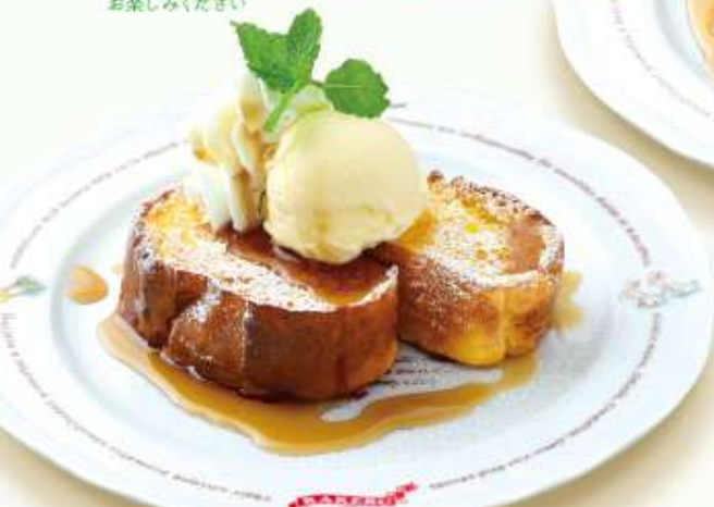
フレンチトースト バニラアイス&ホイップ添え French toast, vanilla ice cream and whip

ラケルのフレンチトーストは、こだわりの卵を使用した アンレイユを染み込ませ……しっとりフワフワ！ パンのはのかな甘みと卵のコク深い味わいをぜひ お楽しみください