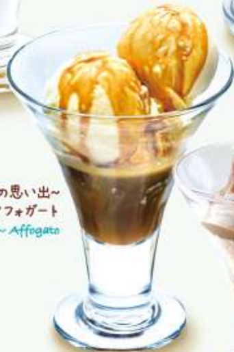
～イタリアの思い出～ アフガート ～Memory of Italy～ Affogato