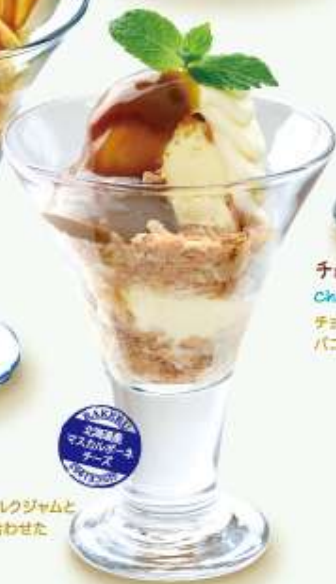
ミルクを食べるサンデー Sundae to eat Milk キャラメルに似た濃厚な味わいのミルクジャムとココウのあるマスカルポーネチーズを合わせたサンデー