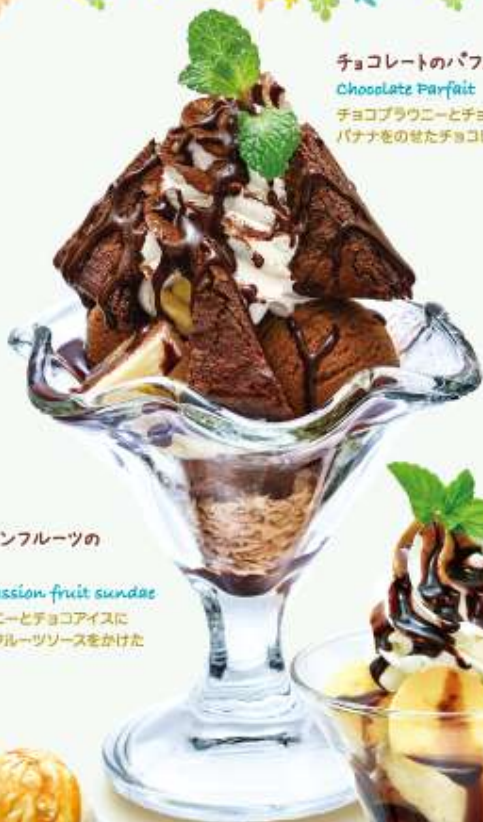
チョコレートのパフェ Chocolate Parfait チョコブラウニーとチョコアイスにバナナをのせたチョコレートパフェです