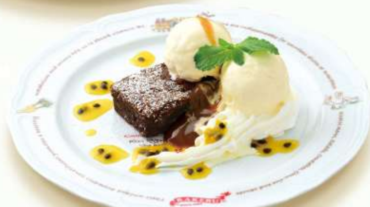
あったかチョコブラウニー バニラアイス添え Warm chocolate brownie, with vanilla ice cream