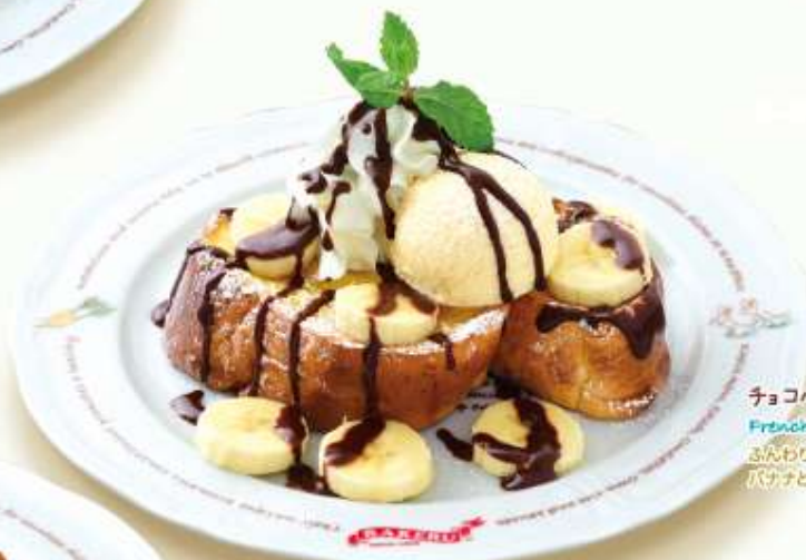
チョコバナナフレンチトースト

French toast, chocolate and banana ふんわり厚切りオリジナルフレンチトーストに バナナとチョコの組み合わせは抜群です