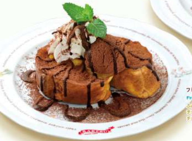
フレンチトースト ダブルチョコレート French toast, double chocolate

ふんわり厚切りオリジナルフレンチトーストに バニラアイスとホイップをのせました ほんのりとけたアイスとメープル系シロップが絡み合って フレンチトーストをさらに美味しく変身させます