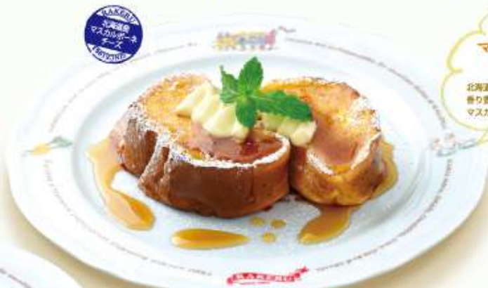
フレンチトースト 北海道マスカルポーネ French toast, Hokkaido mascarpone ふんわり厚切りオリジナルフレンチトーストに マスカルポーネチーズを塗ってさらにリッチな 味わいに……

ふんわり厚切りオリジナルフレンチトーストに チョコレートアイスとチョコレートシロップ、ココアをかけた チョコ感たっぷりフレンチトーストです