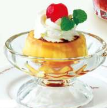
レトロプリン Nostalgie pudding カラメルソースがしみこんだなつかしい雰囲気プリンです