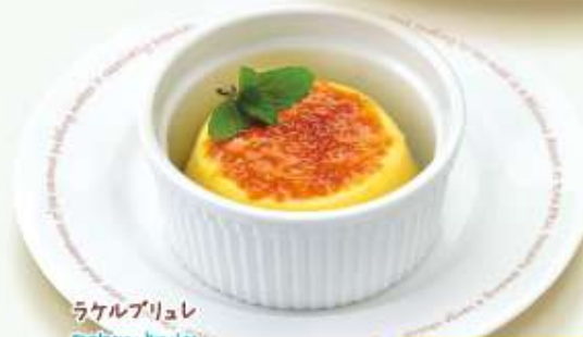
ラケルブリュレ Rakuru brulee どろり食感のブリュレにカリカリ食感のカラメルクラッシュをかけたデザート