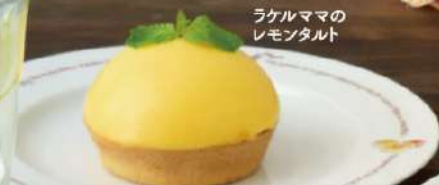
ラケルママの レモントルト