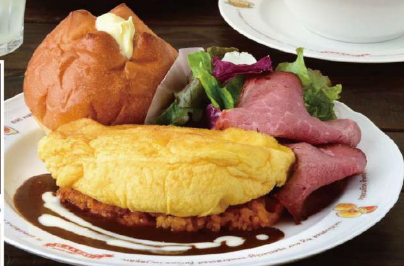
0020 ローストビーフサラダのスフレオムライスプレート デミグラスソース

Roast beef salad & Soufflé omeurice "Mont-Saint-Michel style", demi-glace sauce