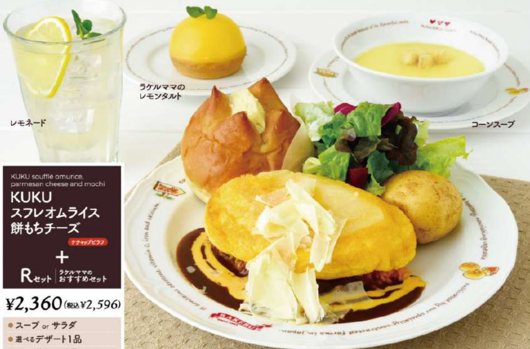
ラケルママの レモンタルト

KUKUとは、オリジナルバター入りスプレッドをたっぷり挟んだふわふわのラケルパンに サラダ、じゃがいもと卵料理を組み合わせたラケルオリジナル料理です。