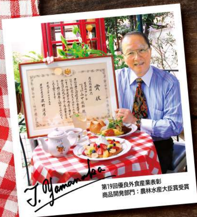
第19回優良外食産業表彰 商品開発部門：農林水産大臣賞受賞

ラケルはもともと小さな珈琲専門店としてスタートしました。「毎日、ホッとする美味しいパンと卵焼きを届けたい」その想いで、心を込めた料理を作り続けてきました。