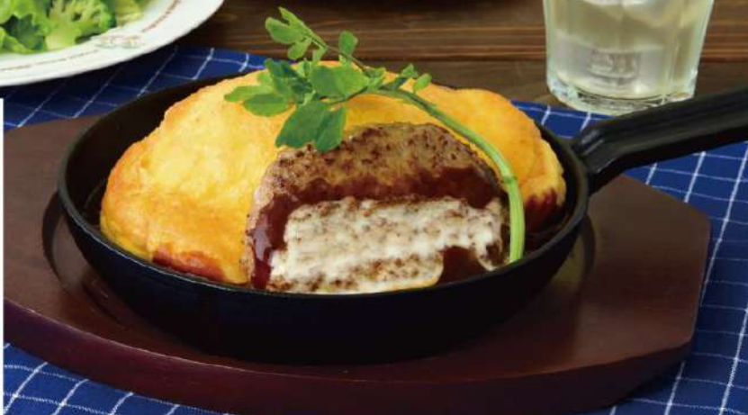
0030 ふんわりスフレオムライス、ハンバーグデミグラスソース