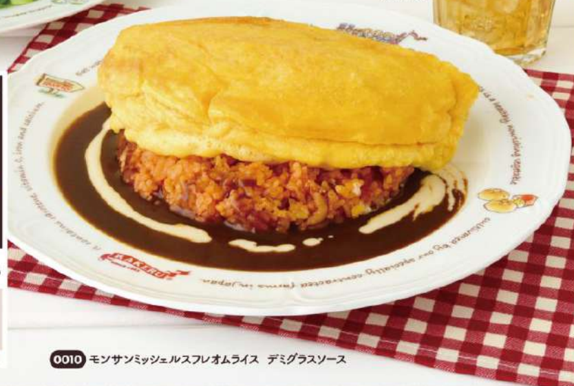
0010 モンサンミッシェルスフレオムライス デミグラスソース

Soufflé omurice, demi-glace sauce, "Mont-Saint-Michel style"